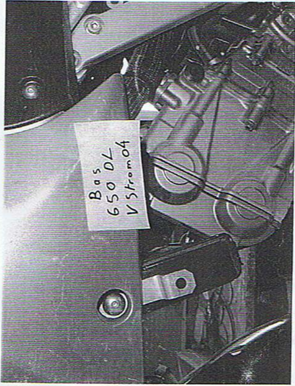
Point supérieur AV. G.