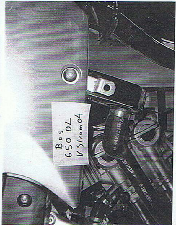
Point supérieur AV. D.